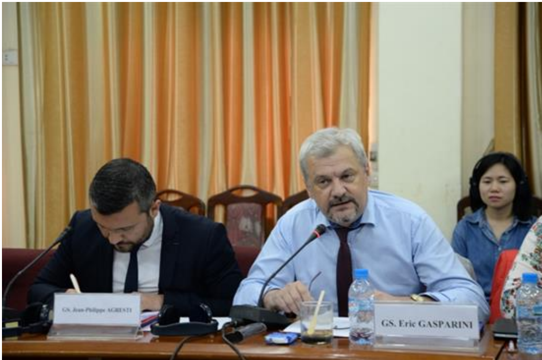
Các giáo sư hai nước cùng nhau trao đổi các chủ đề trong Hội thảo

Phiên làm việc buổi chiều với chủ đề “Truyền thống - hiện đại và minh họa trong lĩnh vực luật dược cổ truyền” các giáo sư đến từ Đại học Aix-Marseille, Đại học Polynesie đã đem đến những bài tham luận đầy sức thuyết phục về việc các giá trị truyền thống, các giá trị văn hóa phi vật thể liệu có đang được “bảo vệ đúng cách” trong môi trường toàn cầu hóa, cũng như những thách thức đặt ra cho hệ thống pháp luật hai nước Việt - Pháp hiện nay trong lĩnh vực y dược cổ truyền.