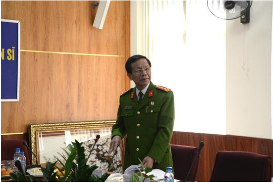
Các thành viên trong Hội đồng đặt câu hỏi và nhận xét