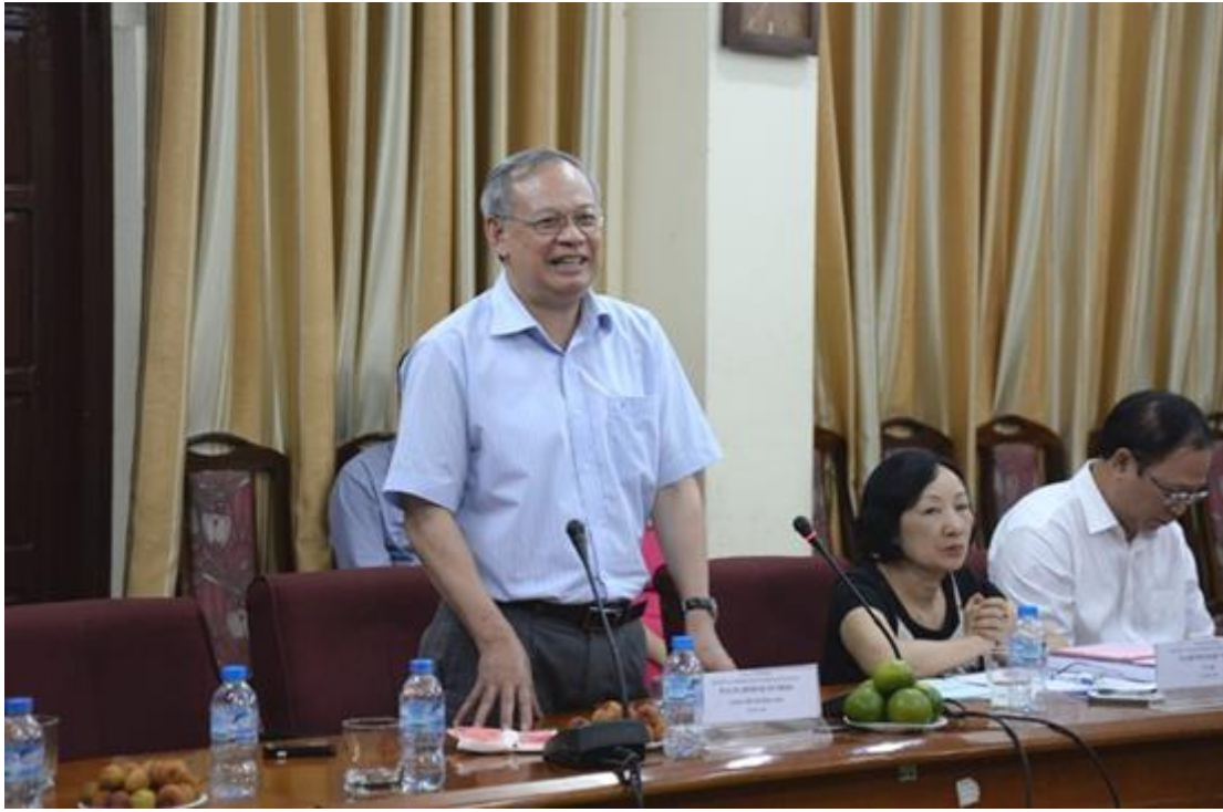
Các thành viên trong Hội đồng đặt câu hỏi và nhận xét