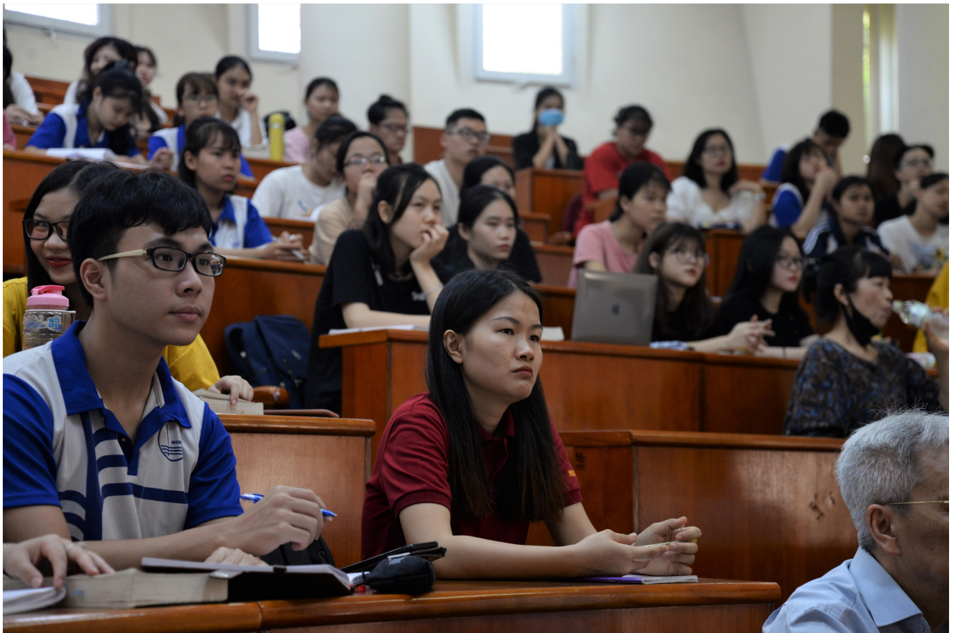
Toàn cảnh Tọa đàm