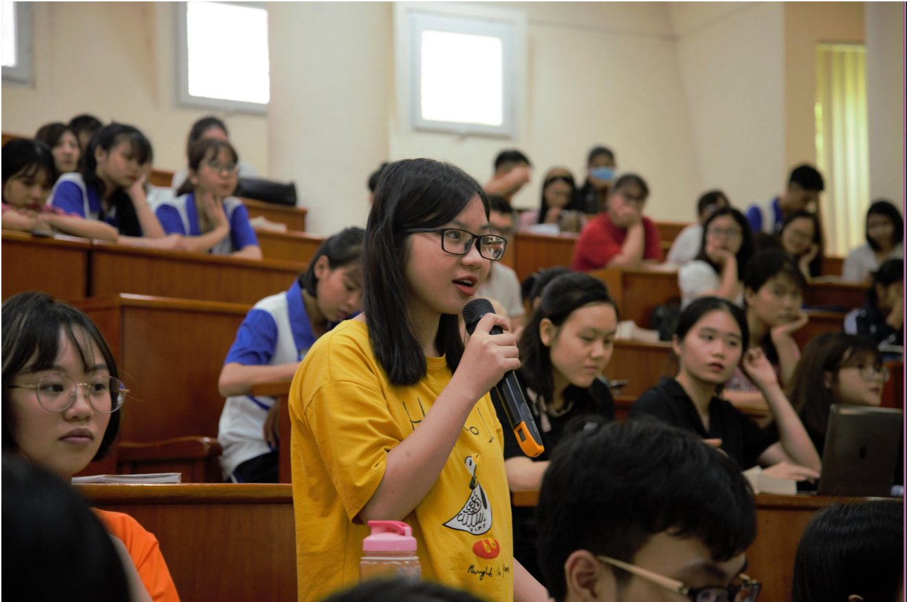
Sinh viên đặt câu hỏi tại Tọa đàm