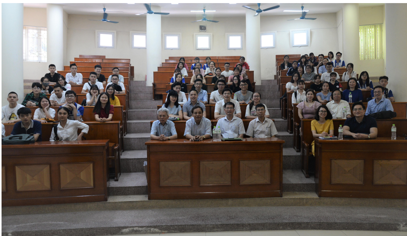
Chụp ảnh lưu niệm